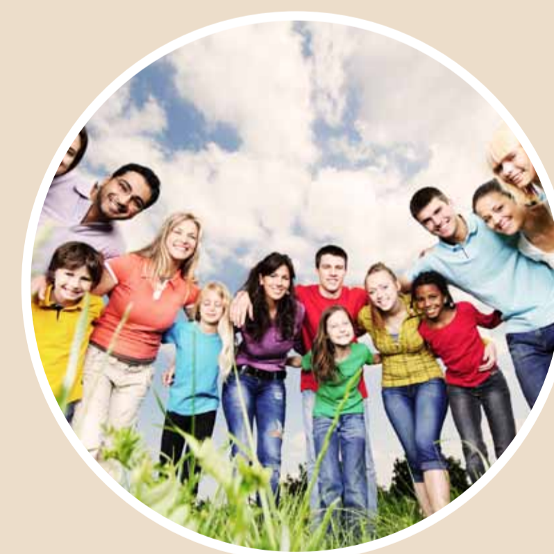
Publikumsattraksjon 400 m 2 2014