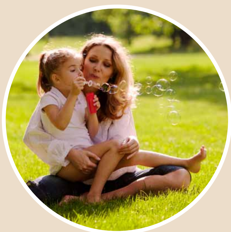
Sentralpark del 1: 2011, del 2: 2012, del 3: 2014