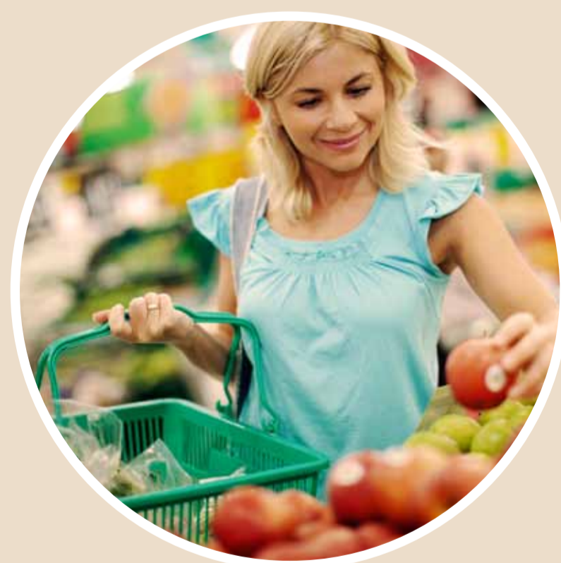
Matbutikk, søndagsåpent, høsten 2013