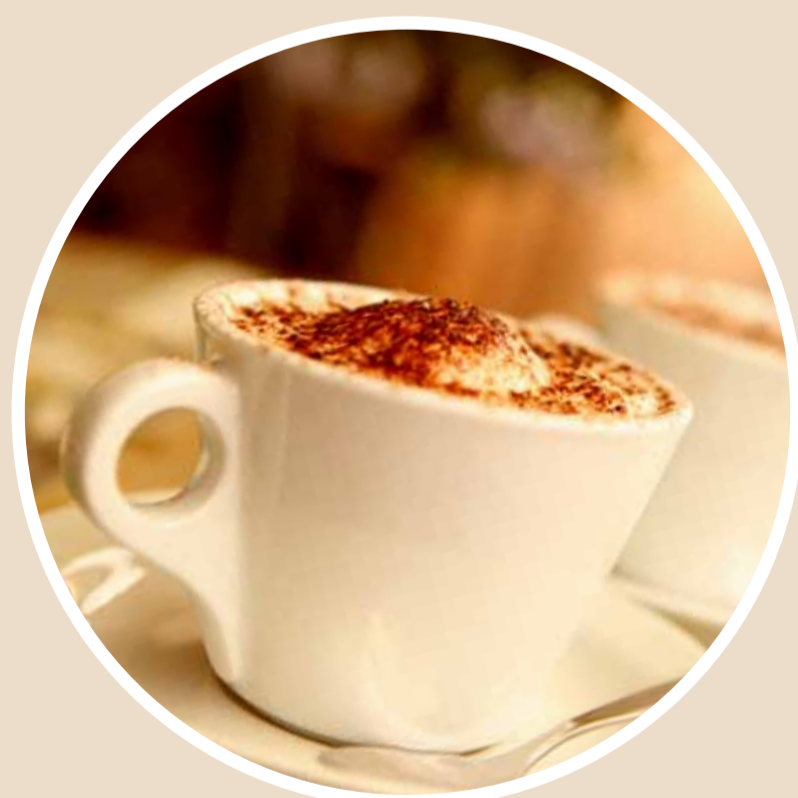
Evita kaffebar 2012