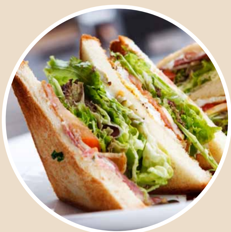
Restaurant våren 2013