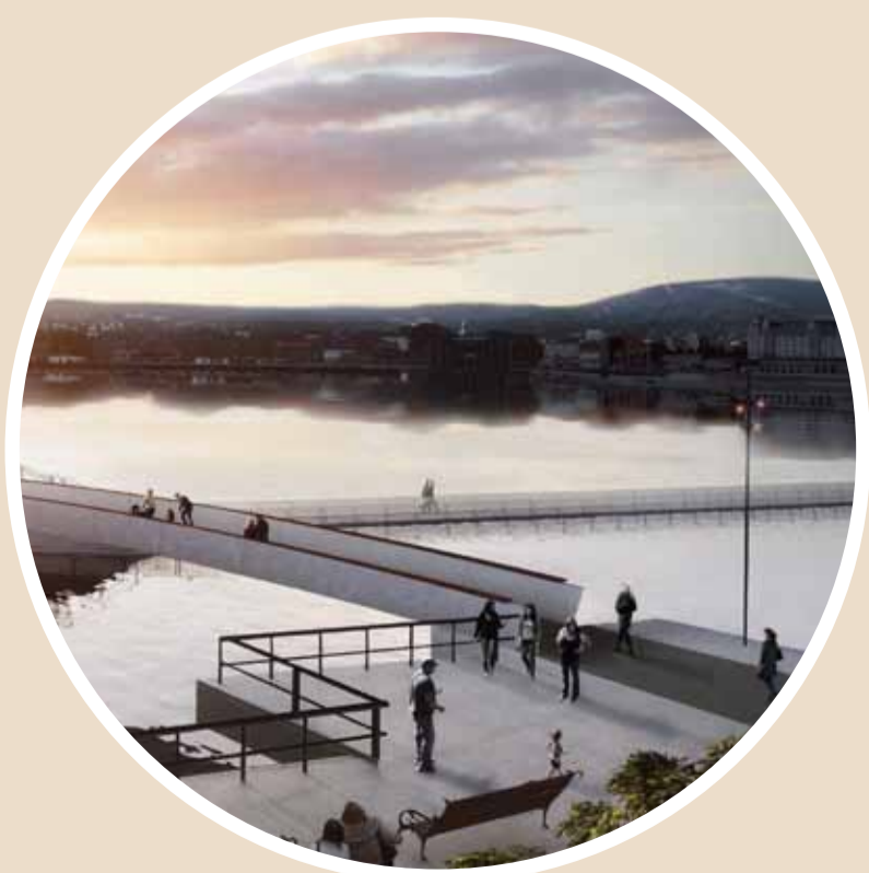
Bro til Operaen åpnet 2011