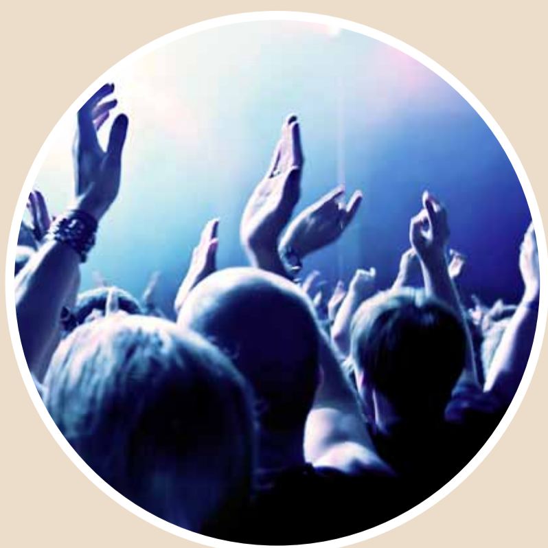
"300 acting spaces" febr 2012 – febr 2013